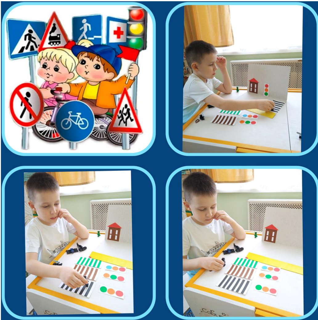
ПДД Дидактическая игра «Сделай выбор»